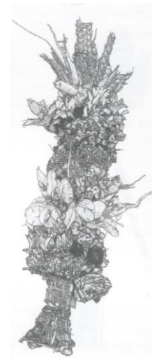
Wiązanka dożynkowa (równianki)