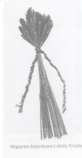
Wiązanka dożynkowa z okolic Knyszyn